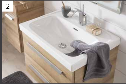
Großzügig geformtes Keramikbecken (BHT: 61 x 6,5 x 46 cm).