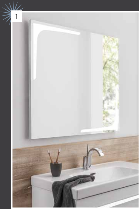
Highlight Modernes LED-Spiegel-element K1 mit satiniertes Eckenbeleuchtung und Sensorschalter.