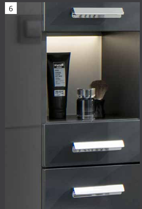
LED-Ambientebeleuchtung für Hochschrank mit Nische als optionales Zubehör.

Wählen Sie unter folgenden Waschtisch-Breiten und Dekoren Ihr persönliches Wunschbad aus.