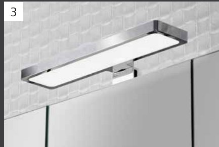
Beste Lichtverhältnisse durch die formschöne Leuchte L2.