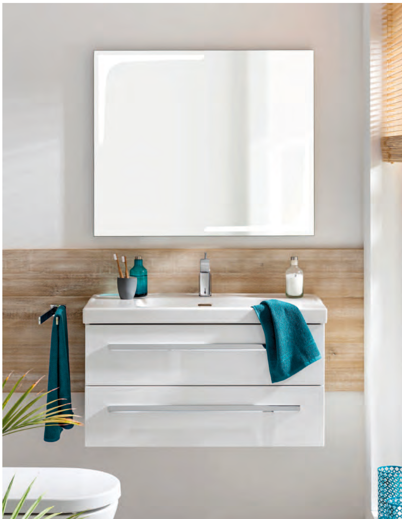
Keramik-Waschtisch, Waschtischunterschrank mit 2 Auszügen, Breite ca. 91 cm, Spiegelelement K1, Breite 90 cm