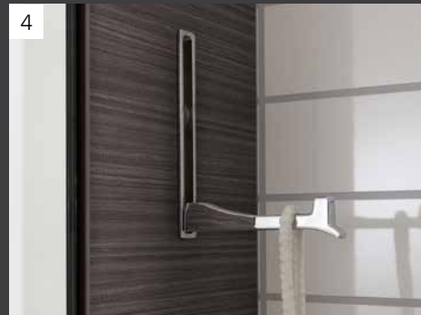
Der standardmäßig rechts und links am Spiegelschrank L8 eingebaute Haken ist eine praktisch-kreative Lösung für ein Plus an Stauraum.

Wählen Sie unter folgenden Waschtisch-Breiten und Dekoren Ihr persönliches Wunschbad aus.