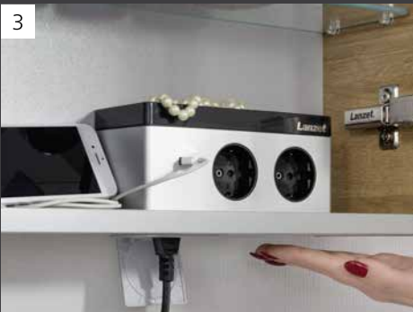
Innovative E-Box Magic mit USB-Anschluss, u. a. zum Aufladen Ihres Smartphones sowie einer spritzwassergeschützten Außensteckdose.