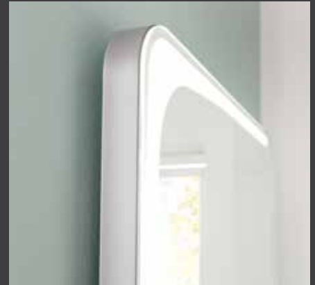
LED-Spiegelement K8 Gästebad mit satiniertes Eckenbeleuchtung

Waschtischunterschrank K8 Gäste (BHT: 55 x 60 x 29,5 cm), 1 Tür, mit Keramik-Waschtisch (BxT: 60 x 30 cm) und beleuchteter Glas- ablage, Spiegelement Rund Ø 60 cm, Handtuchhalter hochkant Edelstahl, gebürstet 45 x 10 cm, Griff Nr. 900