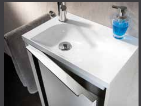
VEDRO Mineralguss-Waschtisch in linker Ausführung

Waschtischplattenlösung Q4-FIT, mit VEDRO-Mineralguss-Waschtisch, tiefenreduzierter Waschtisch-Unterschrank (BHT: 49,2 x 60 x 32,3 cm), 2-türig