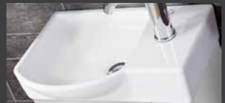
Keramikbecken in linker Ausführung

K3 Gästebad Waschtischunterschrank mit Keramikbecken, in rechter Ausführung