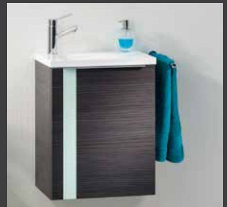
VEDRO Waschtischunterschrank in Dark Oak-Dekor*/Glasintarsie Mint