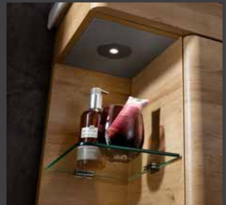
K8 Gästebad Waschtischunterschrank mit beleuchtetem Glaseinlegeboden mittels LED-Spot (durch Bewegungs- melder inkl. Batteriebox)

Wählen Sie unter folgenden Waschtisch-Breiten und Dekoren Ihr persönliches Wunschbad aus.