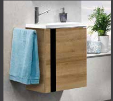
VEDRO Waschtischunterschrank in Berg-Eiche Dekor*/Glasintarsie Schwarz

VEDRO Waschtischunterschrank (BHT: 49,2 x 60 x 32,3 cm) mit Mineralguss-Waschtisch (links und rechts erhältlich) (BxT: 50 x 32,5 cm), Spiegelement VEDRO (BxH: 50 x 84 cm)